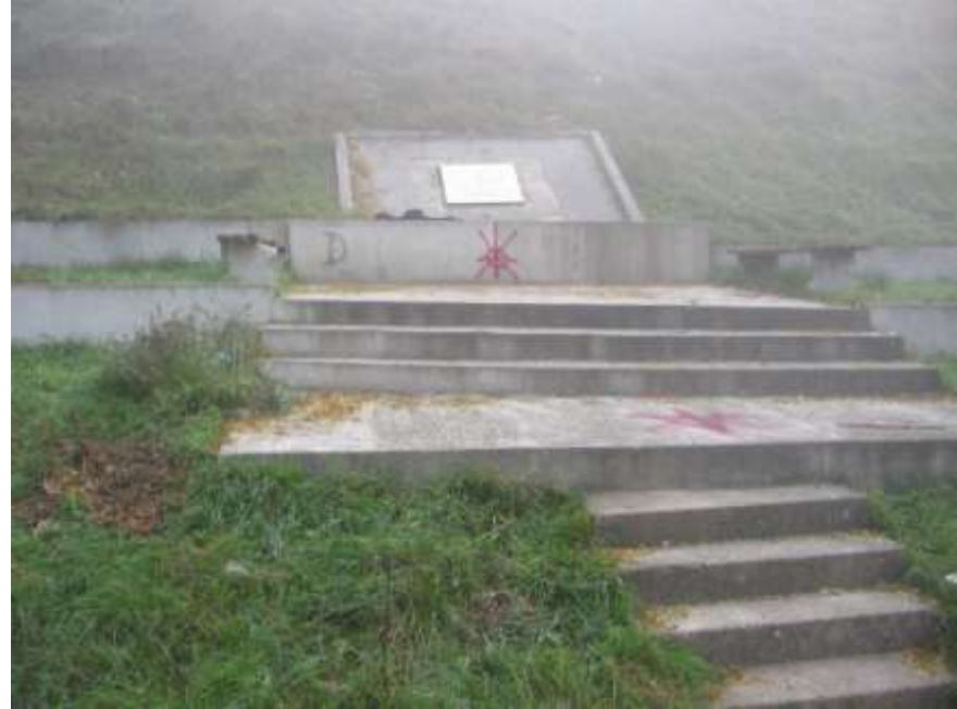
Овако изгледа данас